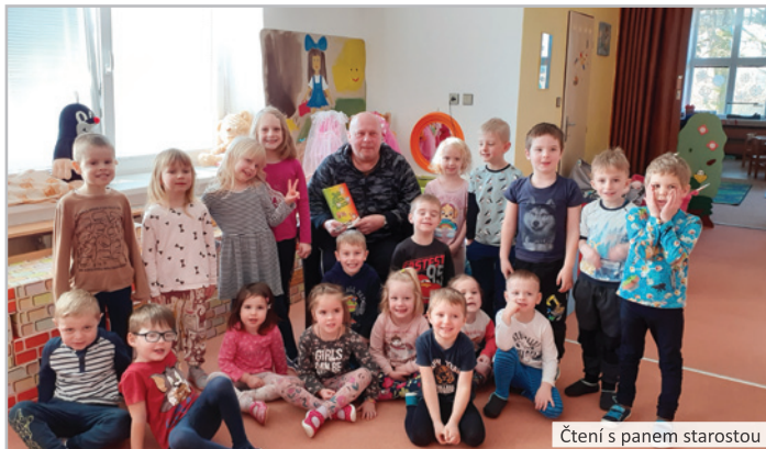
Čtení s panem starostou