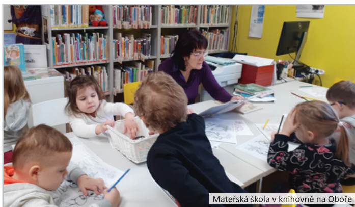
Mateřská škola v knihovně na Oboře