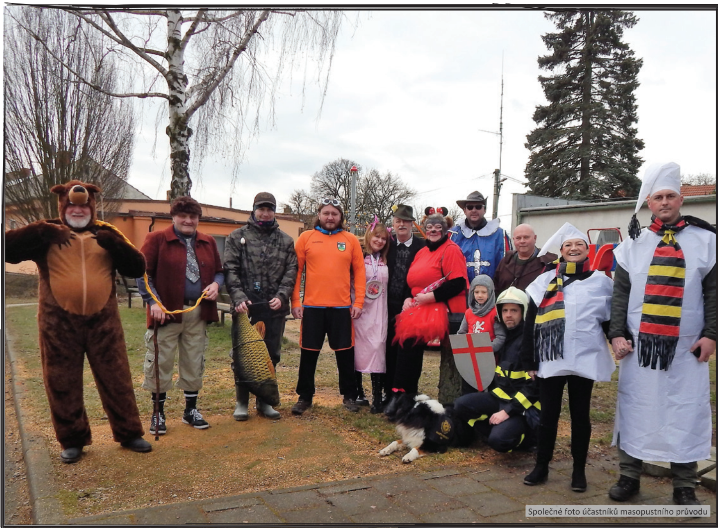
Společné foto účastníků masopustního průvodu

informace z obce • historie z obecní kroniky kulturní akce • z matriky • jubilea • pozvánky